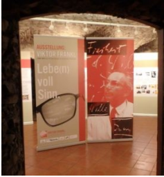
Viktor Frankl Ausstellung am Putzenhof