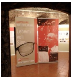
Viktor Frankl Ausstellung am Putzenhof