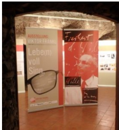
Viktor Frankl Ausstellung am Putzenhof