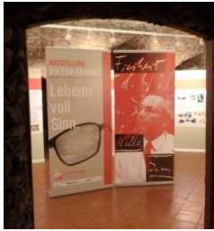
Viktor Frankl Ausstellung am Putzenhof